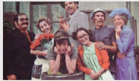
Los personajes del Chavo del 8 que ya partieron