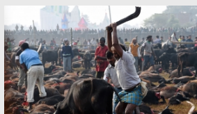
Con sacrificio de animales, inició el Festival Gadhimai en Nepal