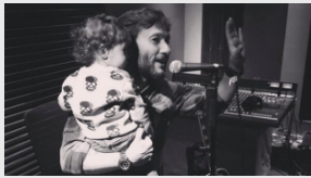
Diego Torres, feliz en su faceta como actor y papá