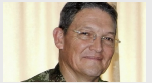
Cronología del secuestro del general Alzate y acompañantes