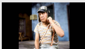
'Chespirito', la genialidad de sus personajes