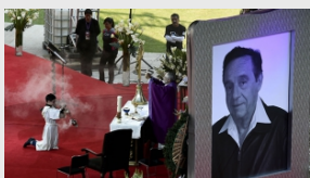
México despidió a 'Chespirito' con gran homenaje en el estadio Azteca