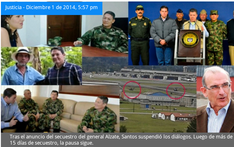
Justicia - Diciembre 1 de 2014, 5:57 pm