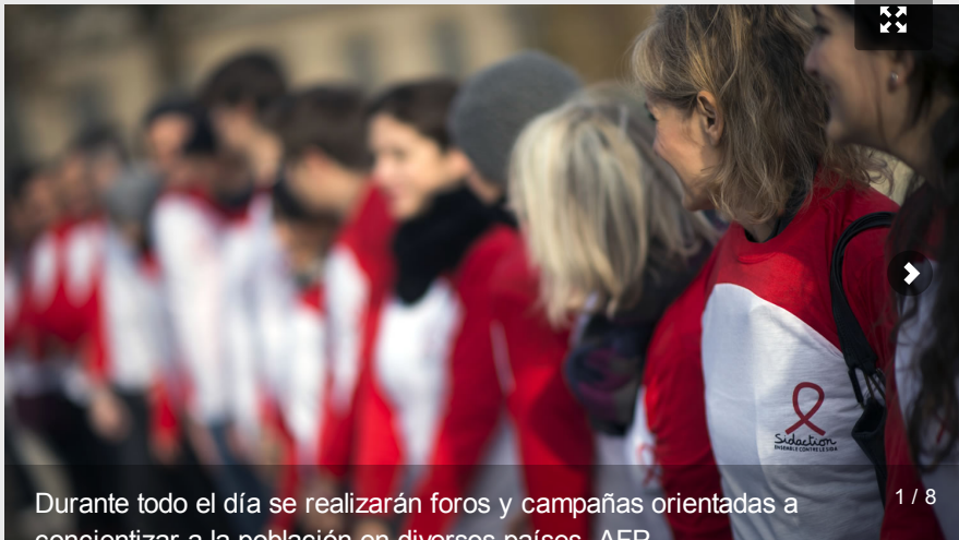
Durante todo el día se realizarán foros y campañas orientadas a concientizar a la población en diversos países.